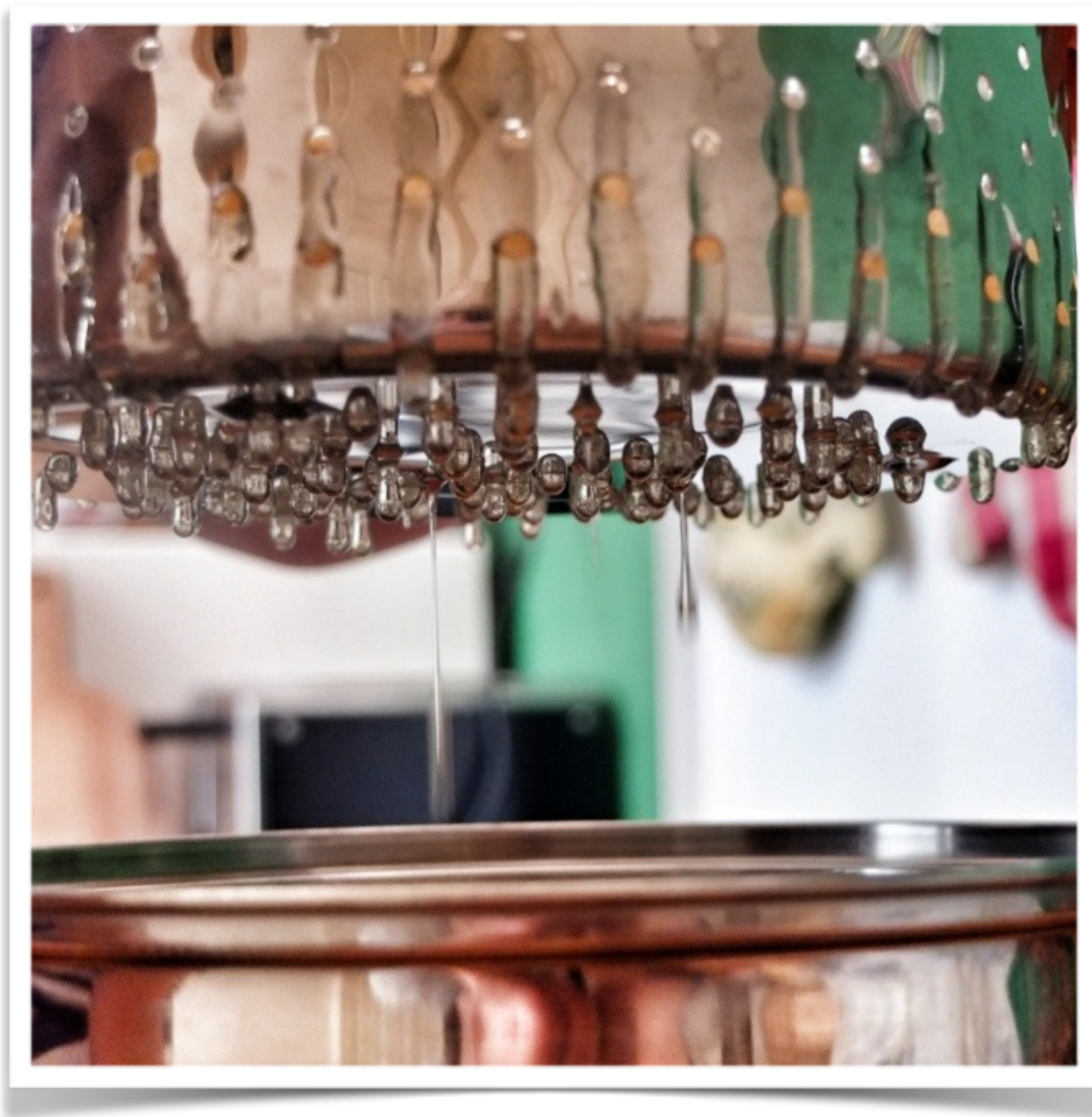
Mikro medárna v hrnci na špagety.