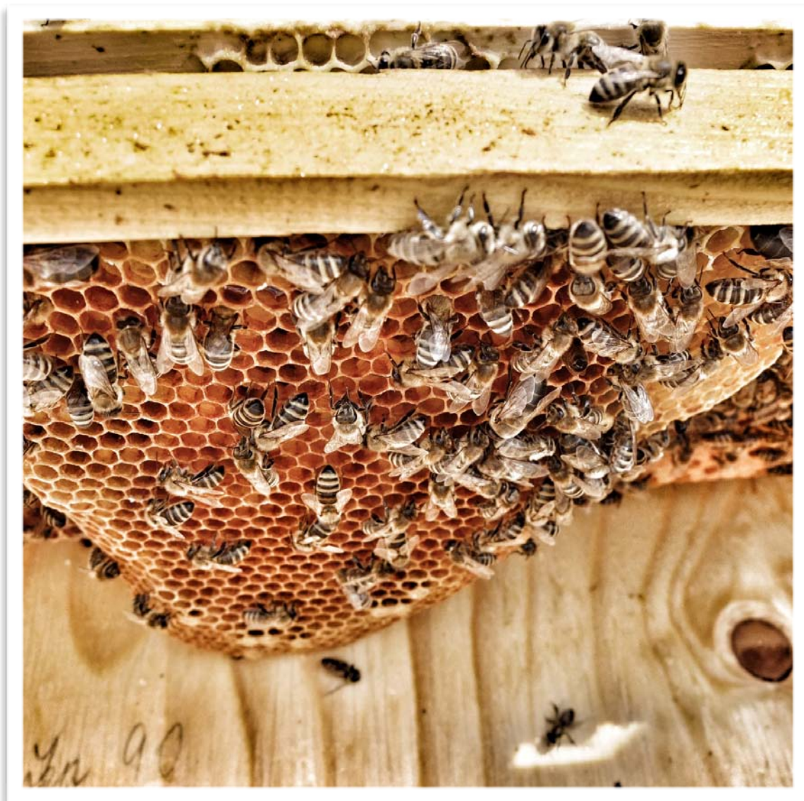
Pohled do úlu s rozestavěným divokým plástem.